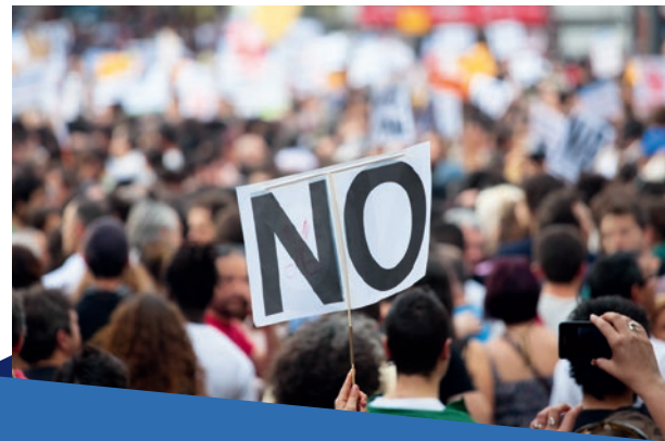
Proteste gegen Zwangsversteigerung

Die neue Syriza-Regierung hat angekündigt, auf nachhaltige Reformen zu setzen. So wurden z.B. 7.000 neue Ärzte eingestellt, die Privatisierung des Hafens von Piräus zunächst gestoppt und die Zwangsversteigerung des Erstwohnsitzes aufgehoben.